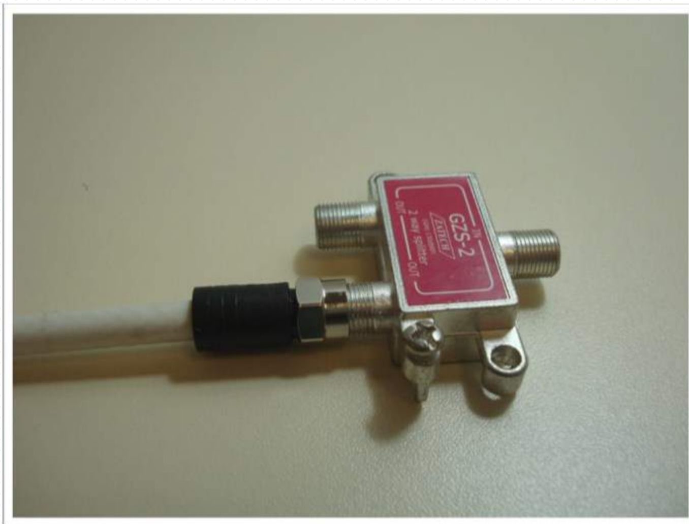
Conector F de compressão, corpo plástico, p/Coaxial RG6