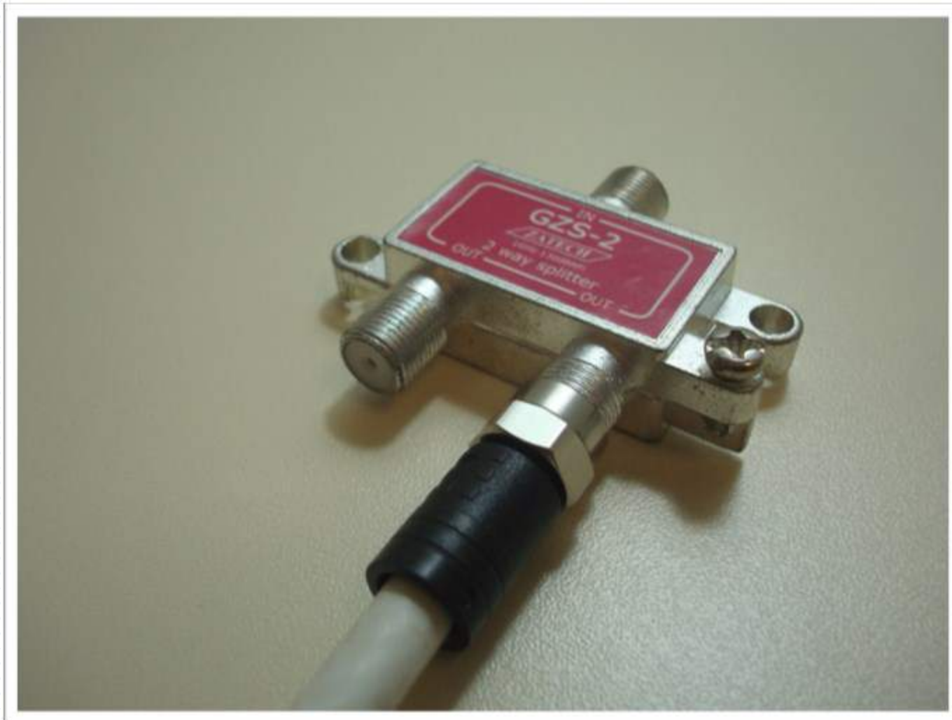
Conector F de compressão, corpo plastico, p/Coaxial RG6